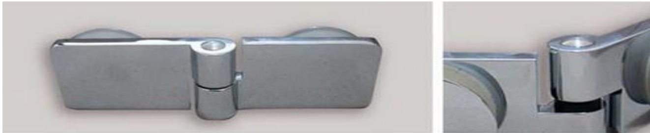
Hebe-Senk Scharnier Glas/Glas 180° rechts (Schraubsystem)